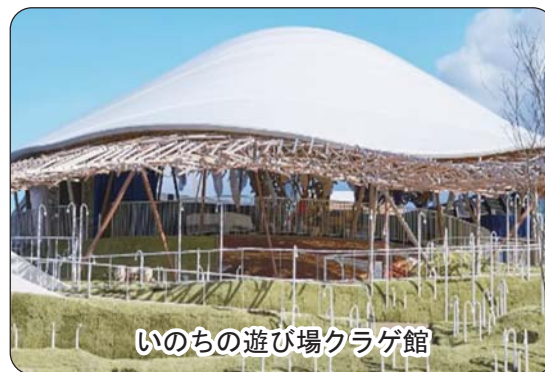
いのちの遊び場クラゲ館

物価の高騰に対応するためとして3億9000万円余を補正しました。また2029年度オーブン予定の未来館の整備を着実に進めていくため、財政調整基金から14億円をこども未来づくり基金に振り替え、同基金の総額は19億円となりました。未来館は「子どもたち