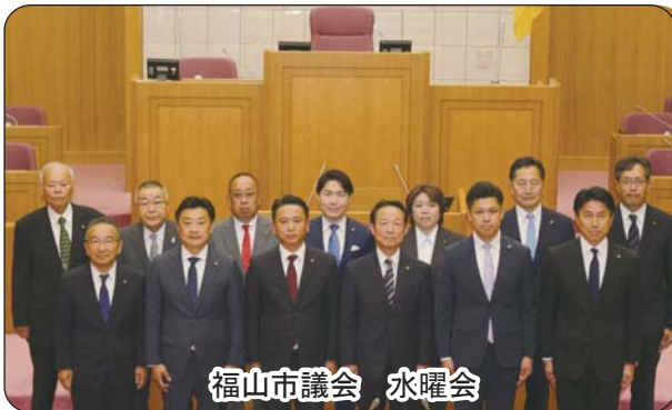
福山市議会 水曜会

建設中の（仮称）まちづくり支援拠点施設の敷地内に（仮称）こども未来館とクラゲ館（公募に参加）を併設することとし、駐車場の配置変更や一般車両の出入口の追加、建築