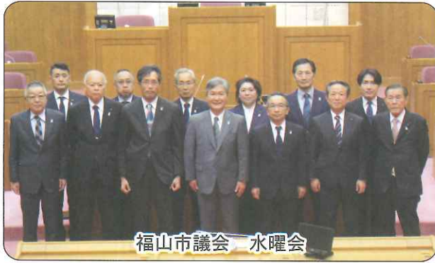
福山市議会 水曜会