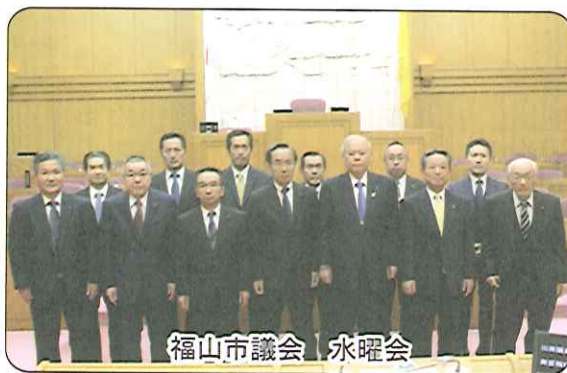
福山市議会 水曜会

一般会計の主なものは、福山城築城400年関連事業として天守閣の夜間照明事業をはじめ、