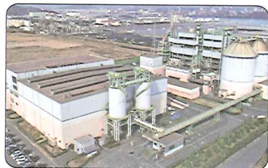
更新予定の現ごみ処理施設(RDF方式)

この事業は、府中市及び神石高原町と広域処理を行うもので、公設民営方式(DBO方式)、いわゆる設計(D)・建設(B)・運営・維持管理(O)を民間業者に一括発注するものです。