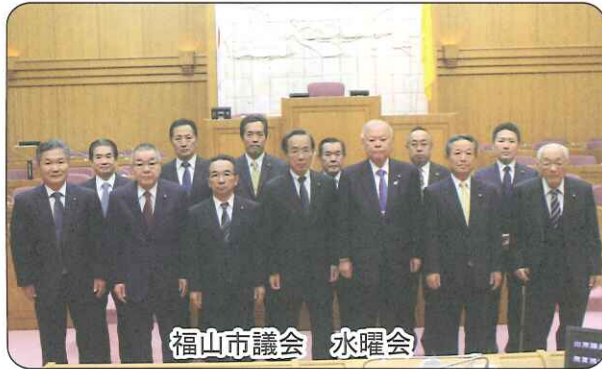
福山市議会 水曜会