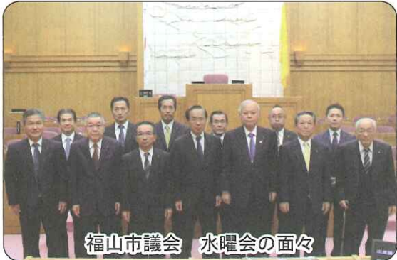
福山市議会 水曜会の面々

に、水路の土砂撤去や来年度以降の浸水対策としての、調査設計費などです。また、土地改良区施設整備補助として、排水機場ポンプ設計・水路掘浚などです。